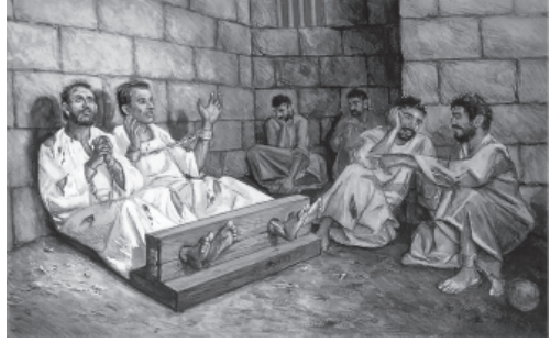
जेल मिं पौलुस और सिलास

जब उ चेलिक मालिकोंल देखौ कि यैबे हमेरि कमाइक जरिया खतम है गो, तब उं पौलुस और सिलास कै पकड़िबेर न्याय करणी सैपोंक सामण खींचबेर ली गई। और उनुधैं यस कौ, "यौं यहूदी मैस छन, और हमर नगर मिं अशान्ति फैलूणई! यौं येसि