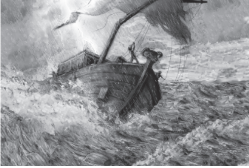
तुफान मिं जहाज

आपण जिन्दगीक लै।" लेकिन सुबदारल पौलुसक बातोंक बदाव जहाजक सैप और मालिकोंक बातों मिं जादे ध्यान दे। उ बन्दरगाह ह्यूनक दिन बितूणक लिजी भल नि छी, यैक लिजी जादे मैस वांबे बाँट लागणक विचार मिं छी। उ कसिकै फीनिक्स मिं पुजिबेर ह्यून काँटणक आँश मिं छी। यैक