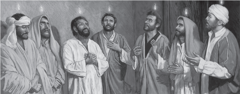
मैंसों मिं पवित्र आत्मा उतरणै

तब भौत मैंस वां यौ देखणक लिजी आई कि यां के है रौ? और वां ऐबेर उनुल सुणौ, कि अरे, यौ मैंस हमेरि भाषा मिं परमेश्वरक महिमा करणई, जबकि हम अलग-अलग देशों बे यां ऐ रयूं, और अलग-अलग भाषा बुलानू! (किलैकि यौ बखत त्यारक कारणल यरुशलेम मिं भौतै मैंस जॉम है राछी) यौ देखिबेर उं दंग हबेर कूण लागी, "के यौ सब गलील प्रदेशाँक मैंस न्हैंतिना? फिर यौ के बात छु, कि हमुमिबे हरेक मैंस इनुकैं आपणि बोलि मिं बुलाण सुणणौ?" और उनुल एक दुसर धैं पुछौ, "यौ के हुणौ!" लेकिन थ्वाड़ मैंसोंल हसि करिबेर कौ, "उं शराब पिबेर नश मिं चूर है रई!"